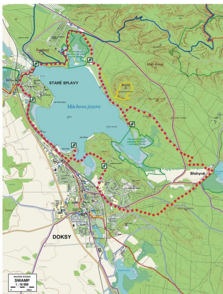
Obr. 1: Mapa naučné stezky SWAMP

Velikost obrázku by měla být taková, aby se, pokud to je možné, využila celá šířka stránky. Pozor ale na deformaci obrázku, poměr výšky a šířky musí být zachován! Obrázek není vhodné zvětšovat tažením myši, raději nastavujeme přímo ve vlastnostech obrázku na šířku textu. Je potřeba zatrhnout volbu „Zachovat poměr výšky a šířky“.